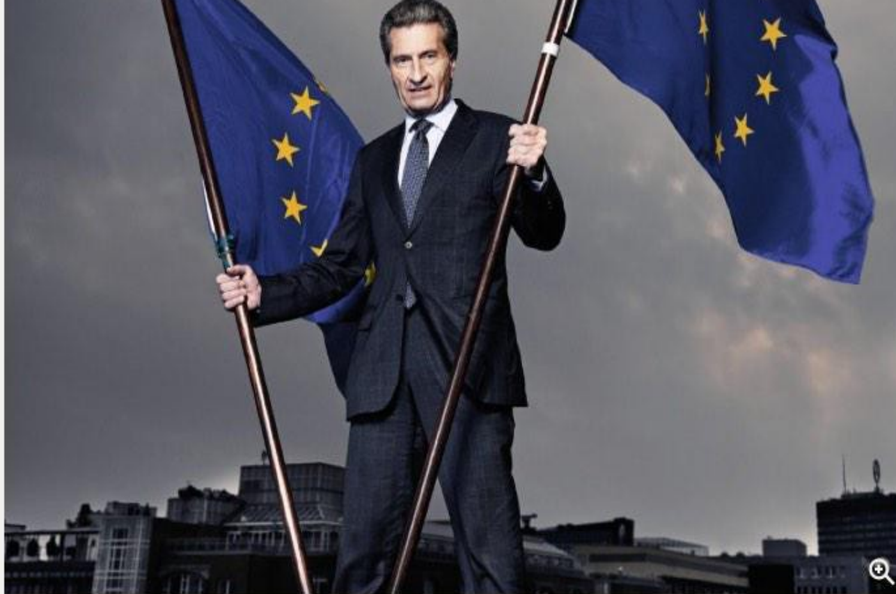
Internetkommissar Oettinger „Der attraktivste Markt der Welt“